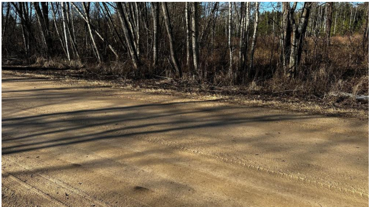
Foto 1. Riigitee nr 22113 km 6,42 ja Puidusoo tee ristumiskoht

Tuginedes Maa-ja Ruumiameti mullastiku kaardirakendusele, esineb ristumiskoha maa-alal leostunud gleimuld (Go). Pinnase uuringu teostamisel määrati, et pinnase lõimis koosneb turvastunud huumushorisondist tusedusega 30 cm, mille all esineb keskliiv (osakeste läbimõõt jääb vahemikku 0,25 kuni 0,5 mm) tusedusega 60 cm, mille all on veeris liivsavi.